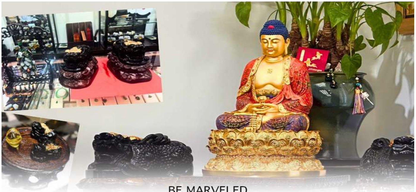
BE MARVELED គុណវិស័យ