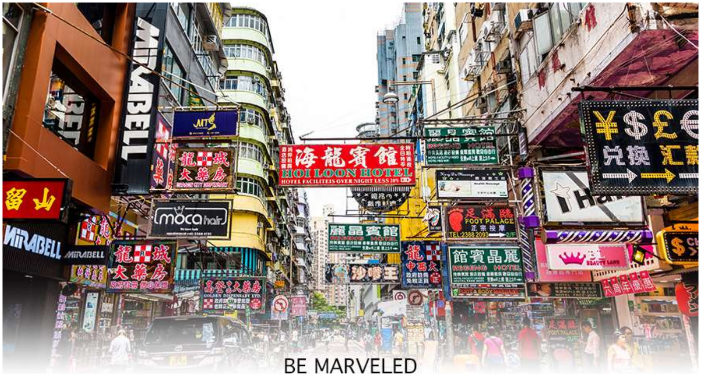
BE MARVELED MONGKOK

เครื่องสำอาง รองเท้า กระเป๋า เครื่องประดับมากมาย อีกทั้งยังมีร้านอาหาร และเครื่องดื่ม ที่ขึ้นชื่อหลากหลายชนิด ให้ทุกท่าน ได้ลองลิ้มรสอีกมากมาย