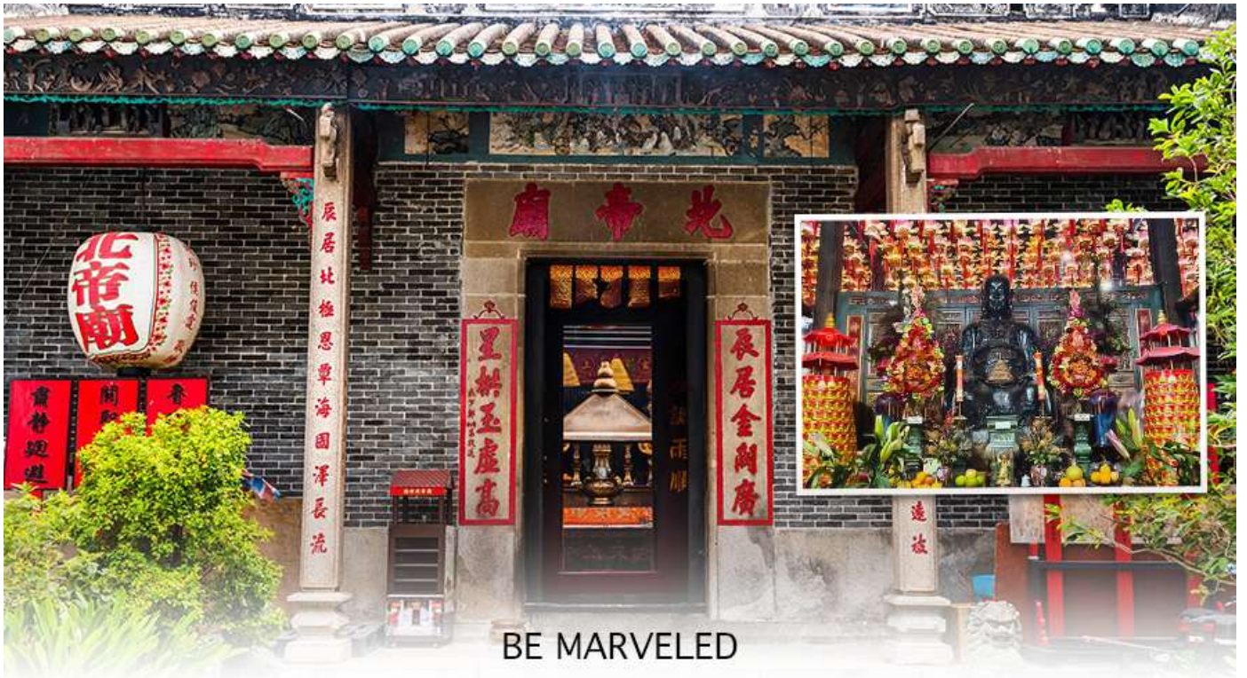
BE MARVELED วัดปักไต่

จากนั้นนำท่าน ช้อปปิ้ง ย่านจิมซาจุ่ย เป็นแหล่งช้อปปิ้งชื่อดัง มีร้านขายของทั้งเครื่องหนัง, เครื่องกีฬา, เครื่องใช้ไฟฟ้า, กล้องถ่ายรูป, อุปกรณ์อิเล็กทรอนิกส์และสินค้าแบบที่เป็นของพื้นเมืองฮ่องกงอยู่ด้วย อีกทั้งสินค้าแบรนด์เนม รวมถึงร้านอาหาร ตั้งอยู่บนถนนนาธาน ถนนทอดยาวตั้งแต่จิมซาจุ่ย จนถึงย่านปรีนซ์เฮ็ดเวิร์ด เต็มไปด้วยร้านค้าต่าง ๆ มากมาย ทั้งเสื้อผ้าแบรนด์เนมระดับ HI-END ชื่อดังทั่วโลก ห้างสรรพสินค้าที่ทันสมัย จากถนน นาธาน ไปที่ถนนแคนตัน ท่านจะตื่นตาตื่นใจไปกับเอาต์เล็ตแบรนด์ที่เรียงติดกันเป็นแถบ นอกจากนี้ยังมี HARBOUR CITY ศูนย์การค้ายักษ์ใหญ่ของฮ่องกง ซึ่งมีร้านค้ากว่า 450 ร้านรวมอยู่ที่นี่ และมี SHOPPING COMPLEX ขนาดใหญ่ชื่อ OCEAN TERMINAL ซึ่งประกอบไปด้วยห้างสรรพสินค้าเรียงรายกันอยู่ และมีทางเชื่อม ติดต่อกันสามารถเดินทะเลถึงกันได้ มีสินค้าแบรนด์ดัง ไม่ว่าจะเป็น GIORDANO, BOSSINI, COACH, LONGCHAMP, LOUIS VUITTON, PRADA, HEMES และอีกมากมายให้ท่านได้เลือกซื้อ