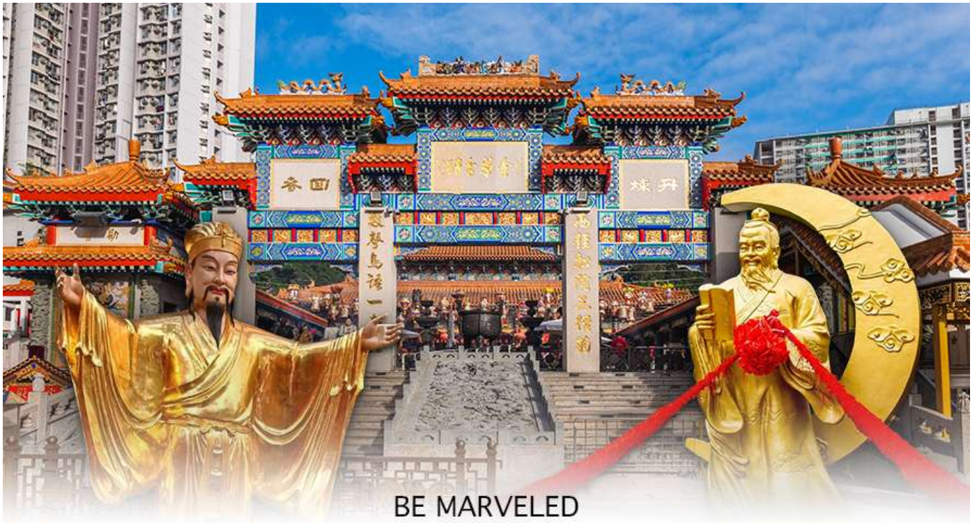
BE MARVELED วัดหวังต้าเซียน

พระหวังต้าเซียน หรือที่รู้จักกันในชื่อ ฮวงชูปิง (Huang Chu-ping) ในช่วงประมาณศตวรรษที่ 4 ได้เดินทางจากเมืองจินมาเผยแผ่ศาสนาในฮ่องกง และสร้างวัดแห่งนี้ขึ้นมาเมื่อประมาณปีค.ศ. 1921 ค่ะ ภายในวัดจะมีทั้ง เทพเจ้าหวังต้าเซียน, เจ้าแม่กวนอิม, เจ้าที่, เทพเจ้าหยุกโหลว (เทพเจ้าแห่งความรัก), ท่านขงจื้อ ซึ่งคนฮ่องกงเอง และนักท่องเที่ยวก็จะมากราบไหว้เพื่อสิริมงคลกัน โดยเฉพาะอย่างยิ่งคือ เทพเจ้าหยุกโหลว หรือ เทพเจ้าแห่งความรัก ที่เราเรียกกันว่า เทพเจ้าด้ายแดง เป็นพิภดที่หลายๆ คนมักจะไปขอความรักจากท่านกัน นอกจากนี้ที่เราจะต้องเอาด้ายแดงมาพันมือนี้อีก ตามป้ายที่แนะนำข้างหน้าแล้ว ไกด์นำเที่ยวคนฮ่องกงบอกว่าถ้าเป็นผู้หญิงอย่างเราอยากได้แฟน ก็ต้องไปผูกด้ายที่รูปปั้นผู้ชายและพอไหว้เสร็จแล้วก็อย่าลืมหยอดทำบุญใส่ตู้ไปด้วย