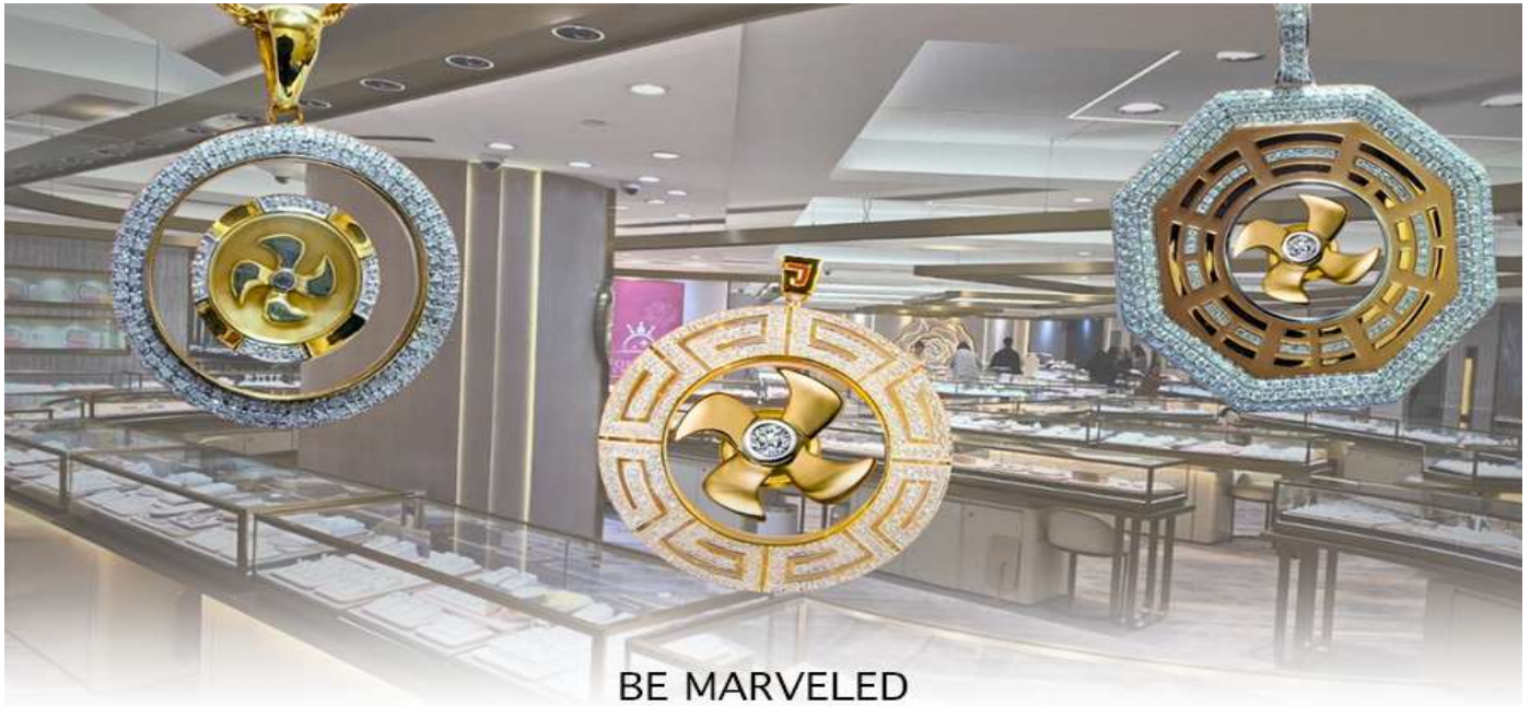
BE MARVELED គុណវិស័យ កំរងអិលធានា