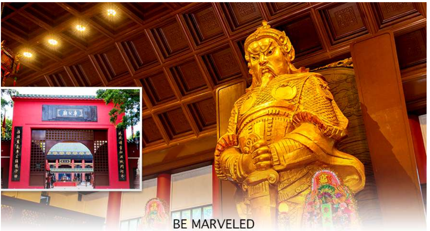
BE MARVELED วัดแชกง

นำท่านเดินทางสู่ วัดแชกงหมิว หรืออีกชื่อหนึ่งว่า “วัดกังหันลม” โดยมีสัญลักษณ์เป็นกังหันนำโชค สร้างขึ้น เพื่อรำลึกถึงท่านแชกงองค์เก่าแก่ มีอายุกว่า 300 ปี ตั้งอยู่ในเขต SHATIN ให้ท่านได้จุดธูปขอพร ลักการะ เทพเจ้า แชกง เป็นอีกหนึ่งวัดที่มีประวัติศาสตร์อันยาวนาน มีตามตำนานเล่ากันว่าได้มีโจรสลัดต้องการที่จะมาปล้นชาวบ้าน เมื่อนายพลแชกงรู้เข้าก็ได้บอกให้ชาวบ้านปักกังหันลมแล้วนำไปติดไว้ที่หน้าบ้าน ปรากฏว่าโจรสลัดได้จากไปและไม่ได้ ทำการปล้น ชาวบ้านจึงมีความเชื่อว่ากังหันลมนั้นช่วยขจัดสิ่งชั่วร้ายที่กำลังจะเข้ามา และนำพาสิ่งดีๆ มาสู่ตน จึงได้ สร้างวัดแชกงแห่งนี้ขึ้น เพื่อระลึกถึงนายพลแชกง และเป็นที่พักการบูชาเพื่อไม่ให้มีสิ่งไม่ดีเกิดขึ้น โดยจะมีวิธีการไหว้ คือ ตั้งจิตอธิษฐานด้านหน้าองค์เจ้าพ่อแชกง จากนั้นให้ท่านหมุนกังหัน จะมีกังหัน 4 ใบพัด แต่ละใบหมายถึงพร 4 ประการ คือ เดินทางปลอดภัย, สุขภาพแข็งแรง, สมความปรารถนา, และ โชคลาภเงินทอง เชื่อกันว่าหากหมุนครบ 3 รอบและตักลง 3 ครั้ง ถือว่าเป็นการช่วยหมุนปัดเป่าเอาสิ่งร้ายและไม่ดีออกไปให้หมด และนำพาสิ่งดีๆ เข้ามาแทน