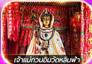
เจ้าแม่กวนอิมวัดหลินฟ้า