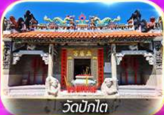
วัดบิกิต