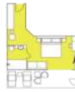
CATEGORY B Balcony Suite (6) app. 32 sqm, incl. Balcony