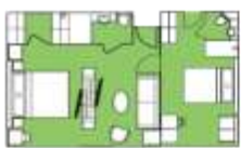
Brynhilde Suite BS Two Bedroom Suite (1) 52 sqm, French Balcony