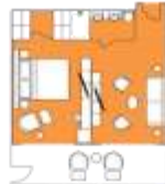
Freydis Suite FS Premium Suite (1) 43 sqm, incl. Balcony