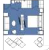
CATEGORY A Junior Suite (4) 40 sqm, incl. Balcony