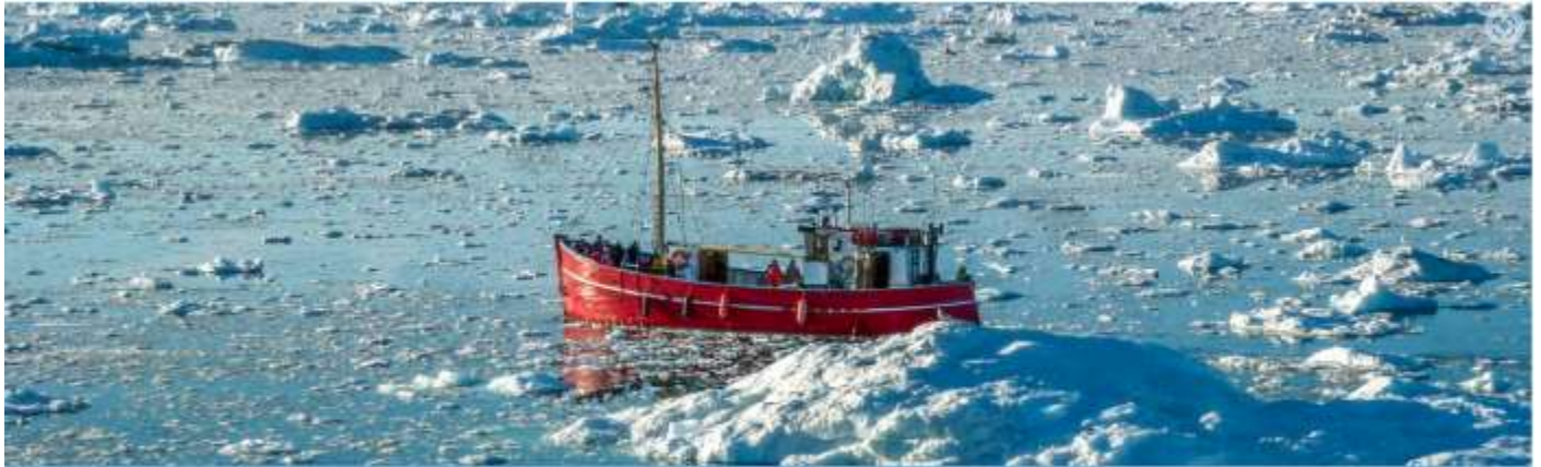
BOAT TRIP TO THE ICE-FJORD, ILULISSAT, GREENLAND

พิเศษ! ห้องพักที่ทางบริษัทจัดให้ จะมีระเบียงส่วนตัวทุกห้อง เพื่อให้ท่านได้ชมวิว และผ่อนคลายตลอดการเดินทาง