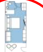
CATEGORY C Balcony Stateroom (57) app. 22 sqm, incl. Balcony