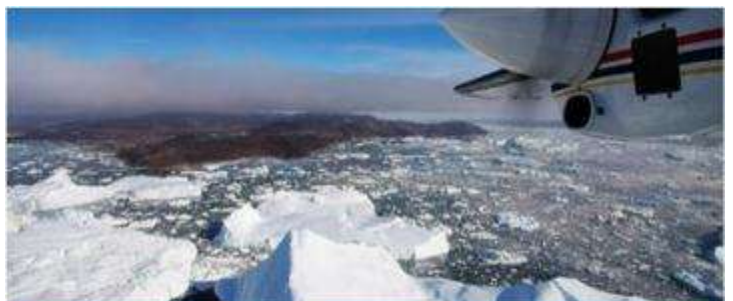
ICE-FJORD FLIGHT SIGHTSEEING, ILULISSAT, GREENLAND

* หมายเหตุ : ทัวร์โดยเครื่องบินเล็กนี้จะขายหมดอย่างรวดเร็ว ดังนั้นจำเป็นต้องจองล่วงหน้า