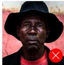
Back side is colored