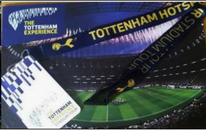
กล้าทำเดินบนหลังคาสนามฯ Sky Walk (£ 35)