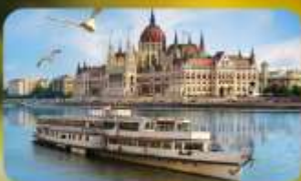
ล่องเรือแม่น้ำดานูบ พร้อมจิบแชมเปญ