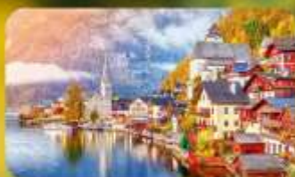
การันตีที่พัก Hallstatt / St. Wolfgang หรือริททะเลสาบ 1 คืน