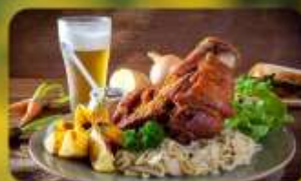
พิเศษ! ลิ้มลองเมนูประจำชาติ ทั้ง 5 ประเทศ!!!