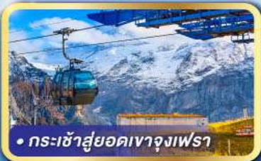
• กระเช้าสู่ยอดเขาจุงเฟรา