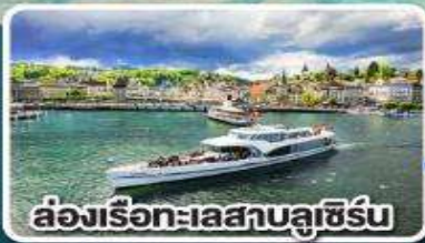
ล่องเรือทะเลสาบลูเซิร์น

เที่ยวครบเส้นทาง Jewels of Romantic Europe ของบาอารีเยอและทีโรล