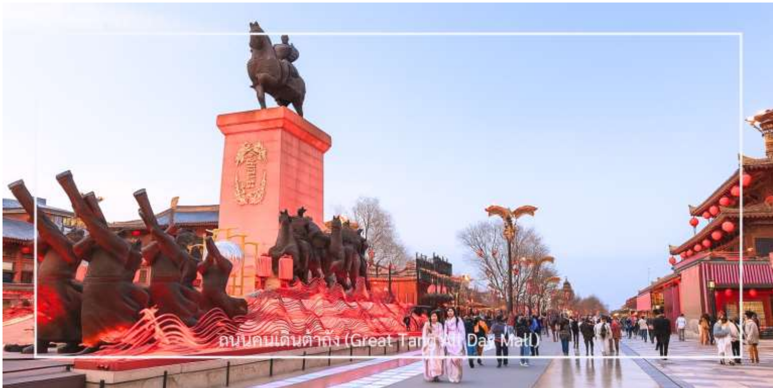
ถนนคนเดินต้ากิ่ง (Great Tang Xi Day Mat)