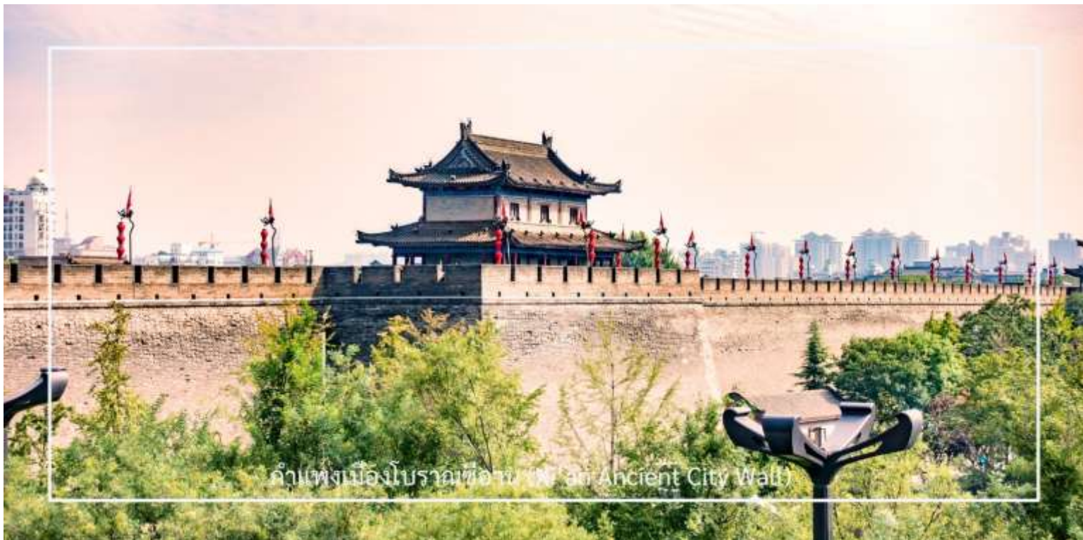
กำแพงเมืองโบราณซีอาน (Xi'an Ancient City Wall)

นำท่านขึ้นชม กำแพงเมืองโบราณซีอาน (Xi'an Ancient City Wall) อีกหนึ่งกำแพงเมืองโบราณเก่าแก่และสมบูรณ์ที่สุดของจีน สร้างขึ้นในสมัยราชวงศ์หมิงเมื่อกว่า 600 ปีก่อน มีความยาวโดยรอบประมาณ 13.7 กิโลเมตร กว้าง 12-14 เมตร และสูงราว 12 เมตร ออกแบบอย่างแข็งแกร่งเพื่อการป้องกันเมือง โดยมีป้อม ประตูเมือง และคูน้ำล้อมรอบ ปัจจุบันกลายเป็นแหล่งท่องเที่ยวยอดนิยม นักท่องเที่ยวสามารถเดินเล่นหรือปั่นจักรยานบนกำแพง เพื่อชมทัศนียภาพของเมืองซีอานทั้งภายในและภายนอกเขตกำแพงได้อย่างชัดเจน