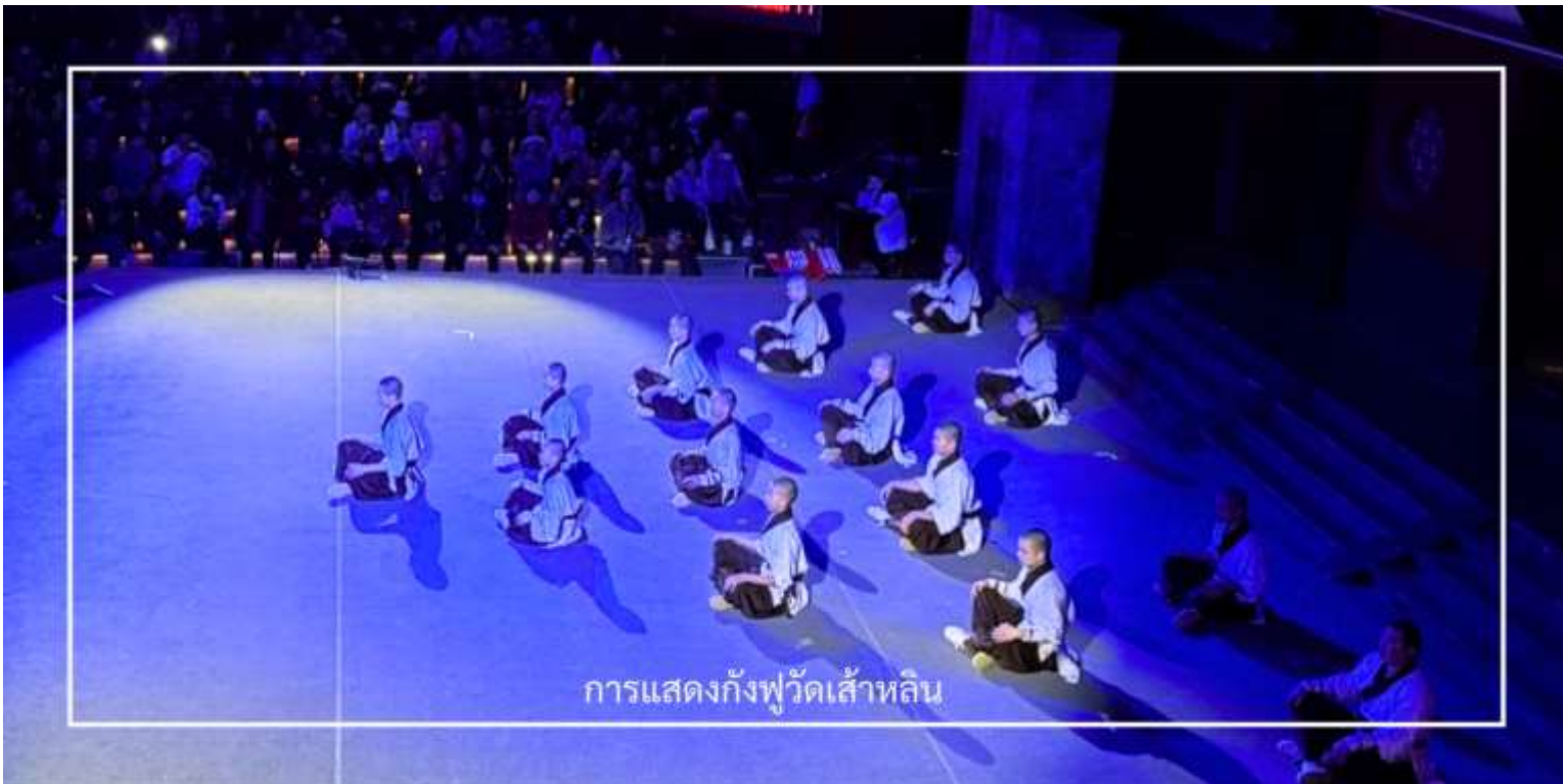
การแสดงกังฟูวัดเส้าหลิน

ไม่พลาด! กับประสบการณ์สุดพิเศษ ชมการแสดงกังฟูวัดเส้าหลิน ศิลปะการป้องกันตัวระดับตำนานที่เลื่องชื่อไปทั่วโลก การแสดงถ่ายทอดความแม่นยำ รวดเร็ว และแข็งแกร่งของวิทยายุทธเส้าหลิน ผ่านกระบวนท่าที่ได้รับแรงบันดาลใจจากสัตว์นานาชนิด เช่น เสือ งู กระเรียน ผสานเข้ากับการตีลังกา หมุนตัว และการควบคุมร่างกายอันน่าทึ่ง ด้วยแสง สี เสียง และดนตรีประกอบฉากที่จัดเต็ม ทำให้โชว์นี้เต็มไปด้วยพลังและความเร้าใจ นอกจากนี้ ผู้ชมยังมีโอกาสได้มีส่วนร่วมบนเวที เพิ่มความสนุกสนาน และประทับใจไม่รู้ลืม