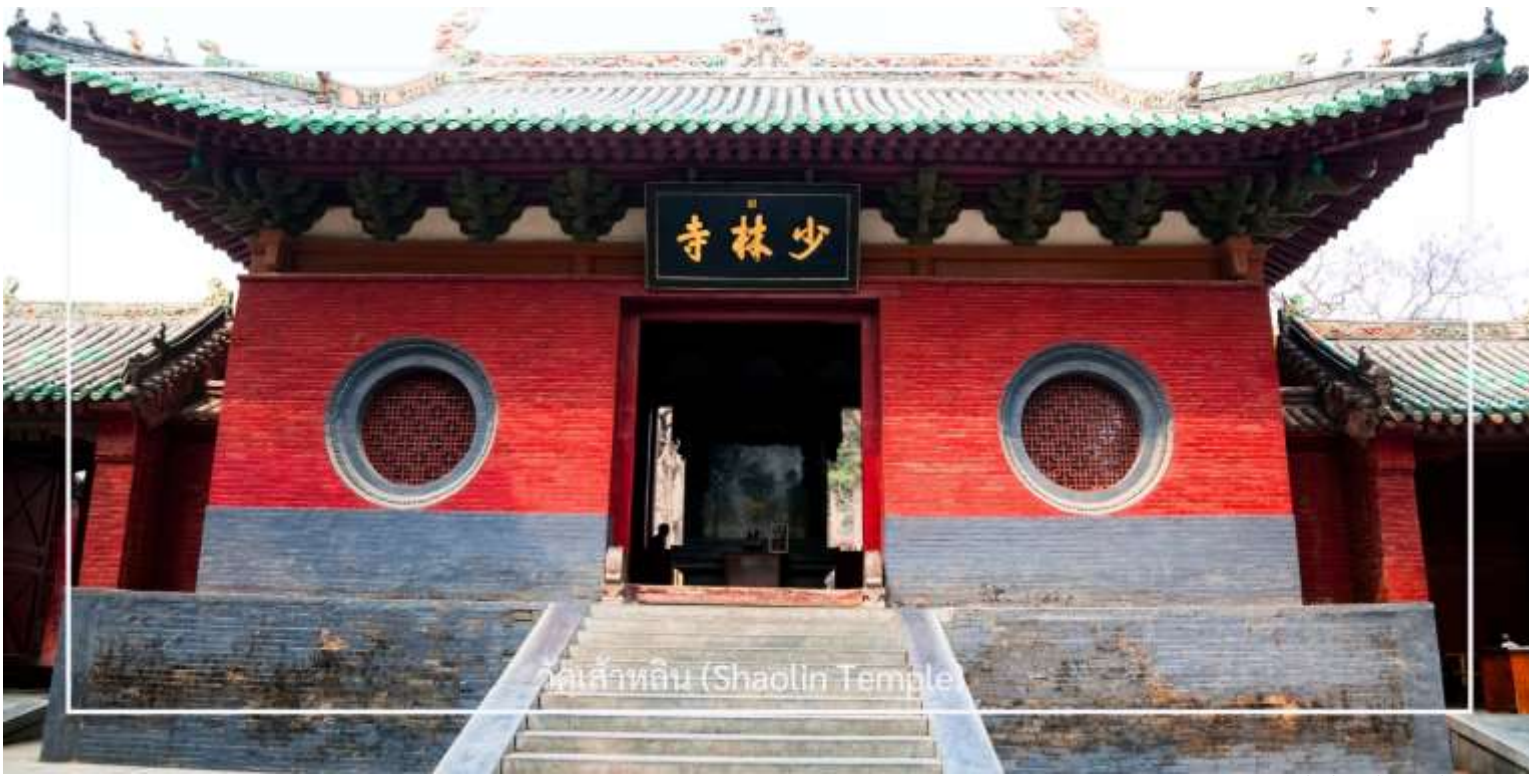
วัดเส้าหลิน (Shaolin Temple)

ไม่พลาด! กับประสบการณ์สุดพิเศษ ชมการแสดงกังฟูวัดเส้าหลิน ศิลปะการป้องกันตัวระดับตำนานที่เลื่องชื่อไปทั่วโลก การแสดงถ่ายทอดความแม่นยำ รวดเร็ว และแข็งแกร่งของวิทยายุทธเส้าหลิน ผ่านกระบวนท่าที่ได้รับแรงบันดาลใจจากสัตว์นานาชนิด เช่น เสือ งู กระเรียน ผสานเข้ากับการตีลังกา หมุนตัว และการควบคุมร่างกายอันน่าทึ่ง ด้วยแสง สี เสียง และดนตรีประกอบฉากที่จัดเต็ม ทำให้โชว์นี้เต็มไปด้วยพลังและความเร้าใจ นอกจากนี้ ผู้ชมยังมีโอกาสได้มีส่วนร่วมบนเวที เพิ่มความสนุกสนาน และประทับใจไม่รู้ลืม