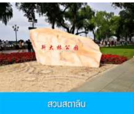
สวนสตาลิน