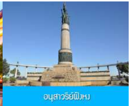
อนุสาวรีย์พิงหวง

หลังอาหารนำท่านชม โบสถ์ เซนต์โซเฟีย 索菲亚教堂 (ชมด้านนอก) อีกหนึ่งสัญลักษณ์ที่โดดเด่นของเมืองฮาร์บิน สร้างขึ้นในปี ค.ศ. 1907 เป็นโบสถ์คริสต์นิกายออร์ทอดอกซ์ ที่ใหญ่ที่สุดในเอเชียตะวันออกเฉียง ที่แสดงถึงอิทธิพลของวัฒนธรรมรัสเซียที่มีต่อเมืองฮาร์บิน