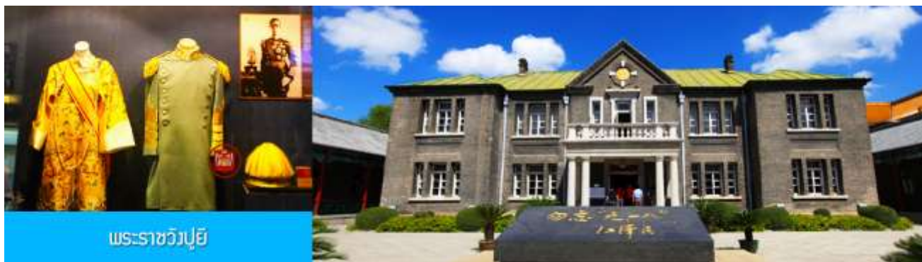
พระราชวังปู้ยี้

รับประทานอาหารเช้า ณ ห้องอาหารของโรงแรม (7)