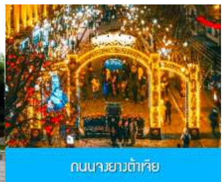
ถนนจงยั้งลู่