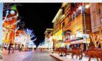
ถนนหวังฝูจิ้ง

*ทางบริษัทฯ ขอสงวนสิทธิ์ในการสลับโปรแกรมทัวร์ตามความเหมาะสมขึ้นอยู่กับสถานการณ์ปัจจุบัน โดยคำนึงถึงผลประโยชน์ของลูกค้าเป็นสำคัญ