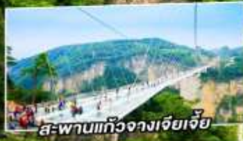
สะพานแกว่งจางเจียเจีย