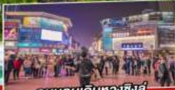
ถนนคนเดินหวงซิงอู่