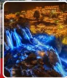
ฟูหลงเจิน