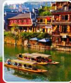
เมืองโบราณฟ่งหวง

อุทยานฉางเจียเจีย เขากียนจื่อซาน สะพานหนึ่งใบใต้หล้า ทะเลสาบเป่าเฟิงหู ตึกมหัศจรรย์ 72 ชั้น เมืองโบราณฟูหลงเจิน เมืองโบราณฟ่งหวง ล่องเรือแม่น้ำถิวเจียง สะพานสายรุ้ง ช้อปปิ้ง ถนนคนเดินหวงซิงลู่