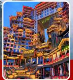
ตึก 72 ชั้น