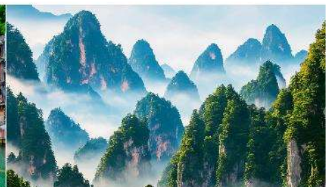
เขากี๋นชื้อซาน

*ทางบริษัทฯ ขอสงวนสิทธิ์ในการสลับโปรแกรมทัวร์ตามความเหมาะสมขึ้นอยู่กับสถานการณ์หน้างาน โดยคำนึงถึงผลประโยชน์ของลูกค้าเป็นสำคัญ