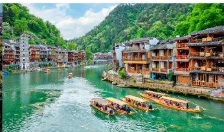
เมืองเฟิ่งหวง