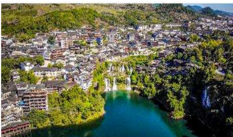
ฝูหรงเจิน