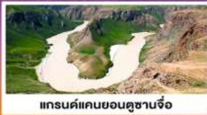
แกรนด์แคนยอนคูซานจื่อ