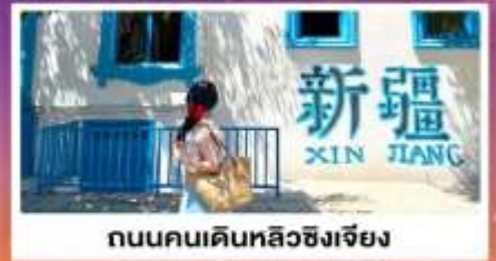
ถนนคนเดินหลิวซิงเจียง