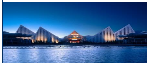
พักที่ INTERCONTINENTAL HOTEL หรือเทียบเท่า 5 ดาว