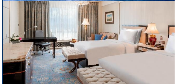
พักที่ INTERCONTINENTAL HOTEL หรือเทียบเท่า 5 ดาว