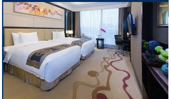
พักที่ DADING CENTURY HOTEL หรือเทียบเท่า 5 ดาว

รายการและเที่ยวบินอาจมีการเปลี่ยนแปลงตามความเหมาะสม