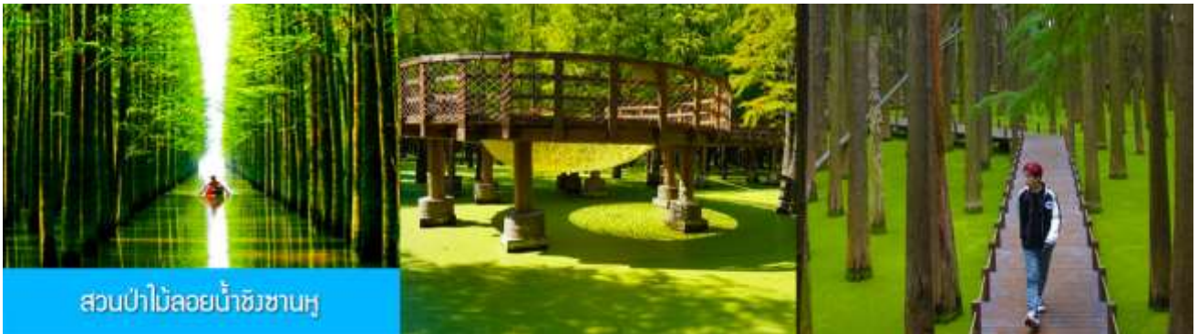
สวนป่าไม้ลอยน้ำชิงชานหู

หลังอาหารเช้าท่านเดินทางโดยรถบัสสู่เมืองหลิงอัน 临安市 (ระยะทาง 175 กม. ใช้เวลาเดินทางราว 2 ชั่วโมงเศษ)