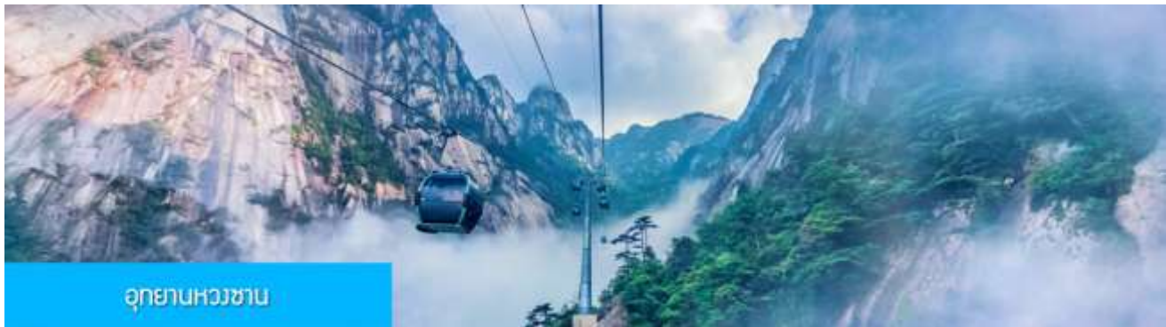
อุทยานหวางซาน