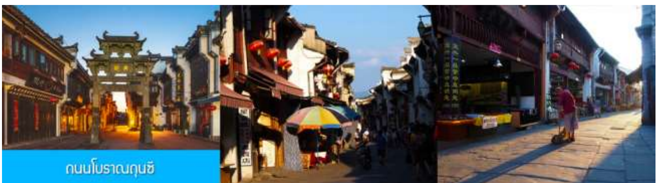
ถนนโบราณถุนซี

เที่ยง อิสระอาหารมื้อกลางวัน ( ท่านสามารถเลือกชิมอาหารพื้นเมืองในระแวกโรงแรมได้ตามอัธยาศัย )