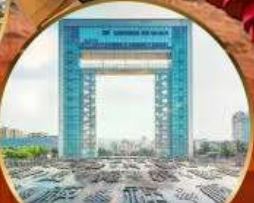
ประตูแห่งความสุข