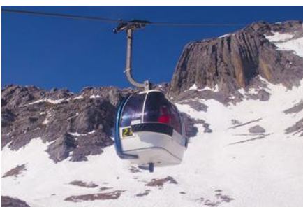
ภูเขาหิมะมังกรหยก (บ่อน้ำขนาดใหญ่)

ที่พัก FENG HUANG HOTEL ระดับ 4 ดาว หรือเทียบเท่าเมืองลี่เจียง