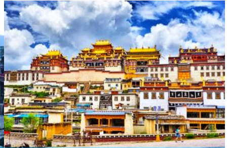
เมืองเซงการีล่า

วันที่สอง เมืองคุนหมิง-นั่งรถไฟความเร็วสูงสู่เมืองต้าหลี่-ช่องแคบเลือกระโจน-จงเตี้ยน-เมืองโบราณเซงการีล่า