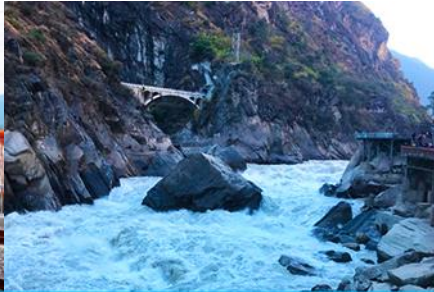
ช่องแคบเลือกระโจน