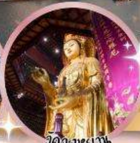
วัดฉงหยวน