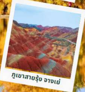
ภูเขาสายรุ้ง อางเย่