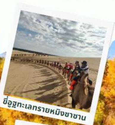
ขี้อูฐทะเลทรายหมิงซาซาน

ชมป่าเปลี่ยนสี ป่าหุหยางหลิงจิงถ่า พิเศษ++ไม่ต้องลากกระเป๋าขึ้นรถไฟ