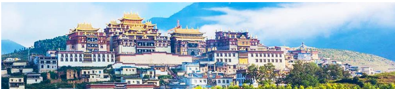
เมืองโบราณแชงกรีล่า

จากนั้นนำท่านเดินทางสู่ เมืองจางเตี้ยน โดยใช้เส้นทางด่วนวิ่งตรงเข้าเมือง จางเตี้ยน ใช้เวลาเดินทางประมาณ 2 ชั่วโมง สู่ เมืองจางเตี้ยน หรือดินแดนแห่งแชงกรีล่า ซึ่งอยู่ทางทิศตะวันออกเฉียงเหนือของมณฑลยูนนานซึ่งมีพรมแดนติดกับอาณาเขตนำซี ของเมืองลี่เจียง และอาณาจักรหิ ของเมืองหนิงหลง สถานที่แห่งนี้จึงได้ชื่อว่า ดินแดนแห่งความฝัน