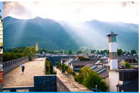
หมู่บ้านซีโจว(หมู่บ้านชาป๋อ)