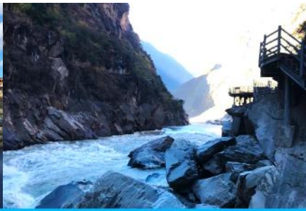
ช่องแคบเลือกระโจน