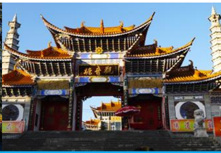
วัดเจ้าแม่กวนอิมเปลงกาย