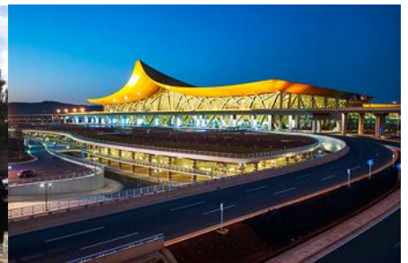
สนามบินเบียวคุนหมิง