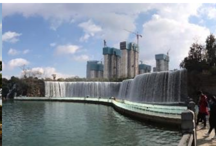
สวนน้ำตก Kunming Waterfall Park