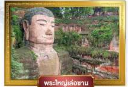
พระใหญ่เล่อซาน