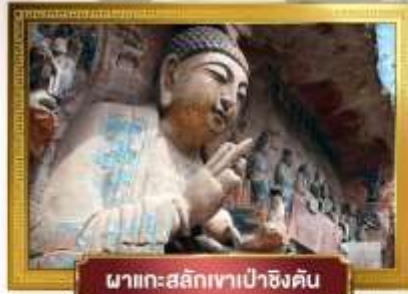
พาหิบนแกะสลักเขาเป่าตั้งชัน