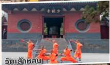
วัดล้าหลิม