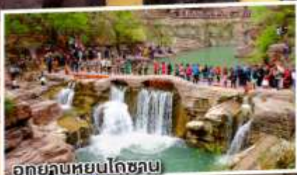
อุทยานหยุนโกซ่าน

เจอะลี้ก สองนครา สามราชวงศ์ 6 วัน 5 คึ้น