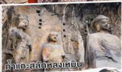
ถ้ำกะสลักหลงเหมิน