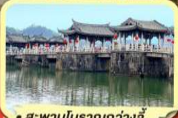
• สะพานโบราณกว้างจี