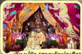
• เอียงบู๊ซิว (ศาลเจ้าพ่อเสือ)