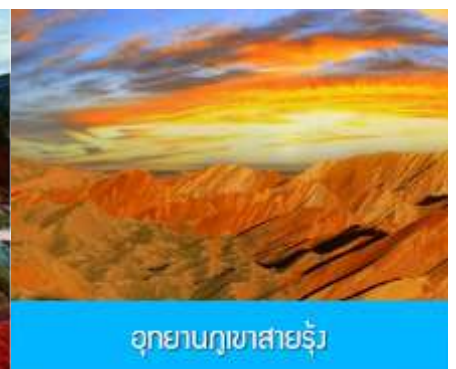
อุทยานภูเขาสายรุ้ง