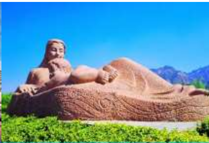
หินแกะสลักมารดาแม่น้ำฮวงโห