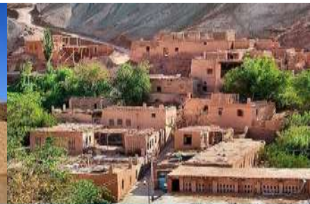
หมู่บ้านอุยกูร์