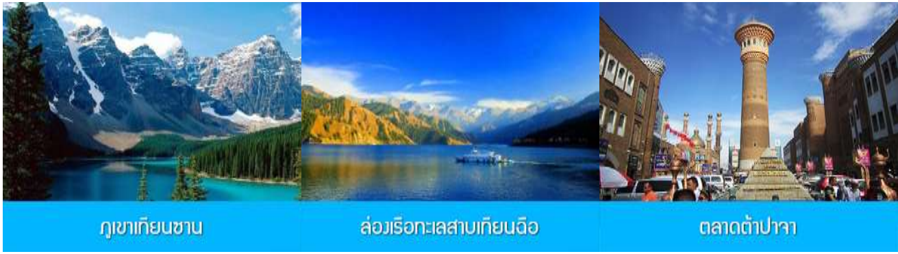
ภูเขาเทียนชาน

ค่ำ รับประทานอาหารค่ำ ณ ภัตตาคาร พักที่ HAMPTON BY HILTON URUMQI HOTEL โรงแรมระดับ 4 ดาวหรือเทียบเท่าในเมืองอูร์มุฉี