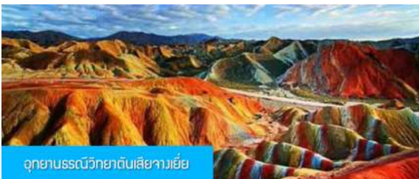
อุทยานธรณีวิทยาตึบเสียวายี่ย

พักที่ JIN WU INTER HOTEL โรงแรมระดับ 4 ดาวท้องถิ่น หรือเทียบเท่าในเมืองหวู่เว่ย