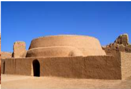
เมืองโบราณเกาซางกูเจี๋ย