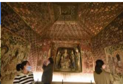
ชมภาพยนตร์ 3 มิติ