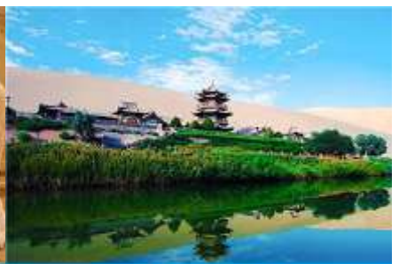
สระน้ำวพระจันทร์