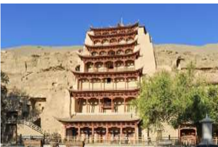
ถ้าห็นมั่วเกา

พักที่ METRO PARK HOTEL โรงแรมระดับ 4 ดาวหรือเทียบเท่าในเมืองตุนหวง