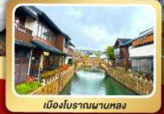
เมืองโบราณผานทหลง