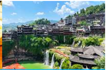
เมืองโบราณผู่หมิงเจี๋ย

วันที่สาม เมืองจางเจียเจี๋ย-ศูนย์แพทย์แผนจีน-ศูนย์จำหน่ายผลิตภัณฑ์ไชชา-ไกด์นำเสนอ OPTIONAL TOUR สะพานกระจกแกรนด์แคนยอน-เมืองโบราณผู่หมิงเจี๋ย