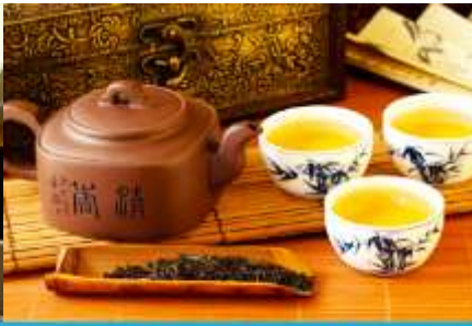
ศูนย์จำหน่ายผลิตภัณฑ์ไชชา