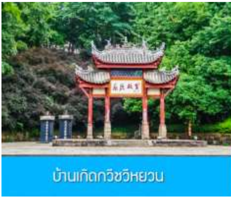
บ้านเกิดกวีชวีหยวน