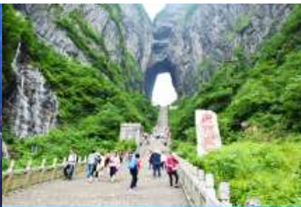
ประตูลูกเต๋อ