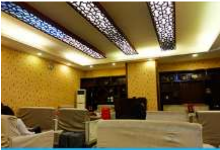
ศูนย์แพทย์แผนจีน

พักที่ HANTING HOTEL ระดับ 4 ดาวท้องถิ่นหรือเทียบเท่าในเมืองจางเจียเจี๋ย