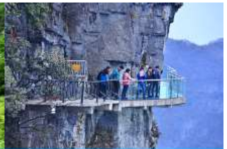
หน้าผาลอยฟ้ากามเดินกระจก

หลังอาหาร ไกด์นำเสนอโปรแกรมทัวร์เสริมหรือ OPTIONAL TOUR แพ็คเก็จท่องเที่ยวภูเขาเทียนเหมินซานหรือภูเขาถ้ำประตูลูกเต๋อ อัตราค่าบริการท่านละ 600 หยวนหรือ 3,000 บาท อัตรานี้รวมค่าบริการเข้าอุทยานฯ รถรับส่ง กระเช้าขึ้น ลงเขาเทียนเหมินซาน ระเบียบกระจกเลียบน้าผา บัน ไคเลี่ยนทะเลภูเขา ค่าประกันอุบัติเหตุ และค่าบริการของไกด์ท้องถิ่น ระยะเวลาสำหรับแพ็คเกจประมาณ 3-4 ชั่วโมง (ขึ้นอยู่กับจำนวนนักท่องเที่ยวในแต่ละวัน)