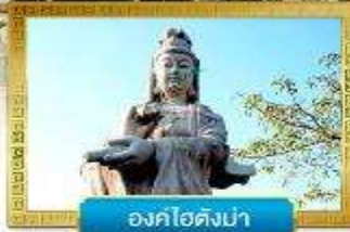
องค์ไร่ดงม้า