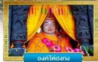
องค์ไตองกง