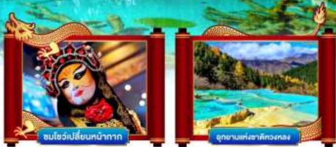
ชมโชว์เปลี่ยนหน้ากาก