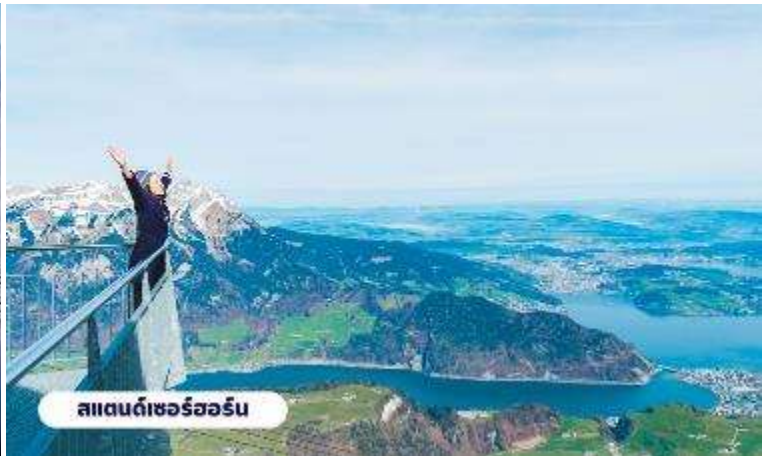
สแตนเดอร์ฮอร์น