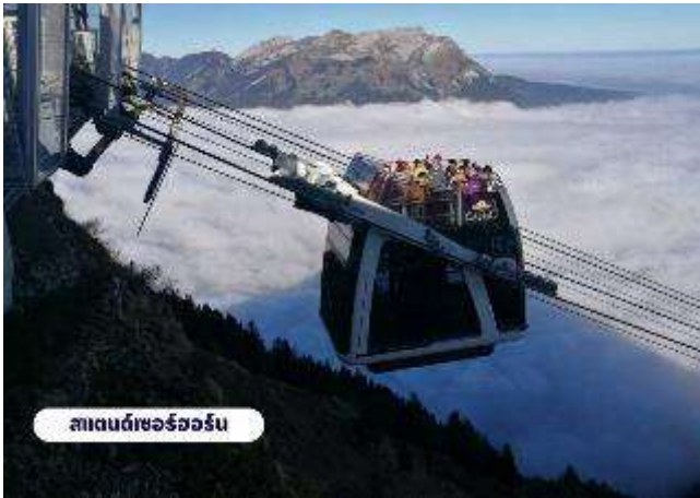
สแตนเดอร์ฮอร์น

☉ บริการอาหารเช้า ณ ห้องอาหารของโรงแรม จากนั้นนำท่านเดินทางสู่สถานีกระเช้า เพื่อเตรียมตัวเดินทางขึ้นสู่ ยอดเขาสแตนเซอร์ฮอร์น (Mt.Stanserhorn) มีความสูงที่ 1,898 เมตร(6,227 ฟุต) ระหว่างทางคุณจะได้ชมวิวแบบพาโนรามาและให้ท่านได้สัมผัส การเดินทางโดยขึ้นกระเช้า “Cabrio” กระเช้าลอยฟ้าเปิดประทุนที่มี 2 ชั้นแห่งแรกของ โลก และสามารถจุผู้โดยสารได้เกือบ 60 ท่าน โดยขึ้นดาดฟ้าจะสามารถดูได้ 30 ท่าน ระยะ เกือบ 2 กิโลเมตร ระหว่างทางขึ้นสู่ยอดเขาท่านจะสามารถมองเห็นวิวแบบ 360 องศา จากนั้นให้ท่านได้เพลิดเพลินกับความสวยงามของธรรมชาติและทัศนียภาพที่งดงาม