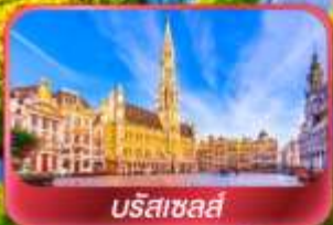
บรัสเซลส์