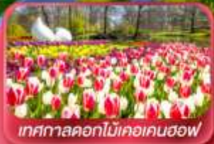
เทศกาลดอกไม้เคอเคนฮอฟ