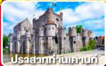
ปราสาทท่านเคานท์