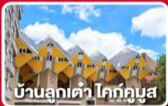
บ้านลูกเต่า ไคท์คูบัส