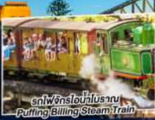
รถไฟจักรไอน้ำโบราณ Puffing Billington Steam Train