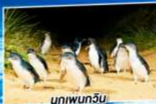
นกเพนกวิน

จัดเต็มทุกล้อสเตอร์ ท่านละ 1 ตัว พร้อมไวน์ชั้นเยี่ยม