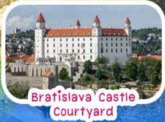
Bratislava Castle Courtyard